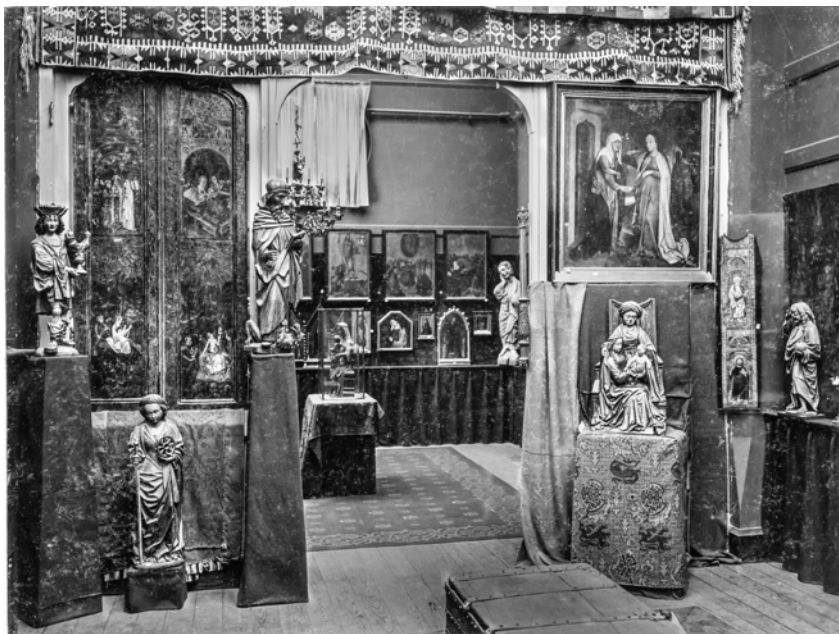
Afb. 4. Tentoonstelling Middeleeuwse Kunst, Utrecht, 1906, interieur bij de trap.