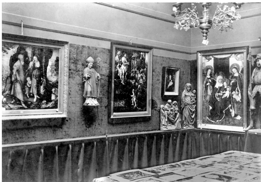
Afb. 8. Tentoonstelling Middeleeuwse Kunst, Utrecht, 1906, grote zaal links.