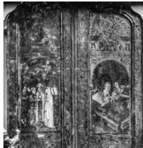
Fotobewerking Lex Raat