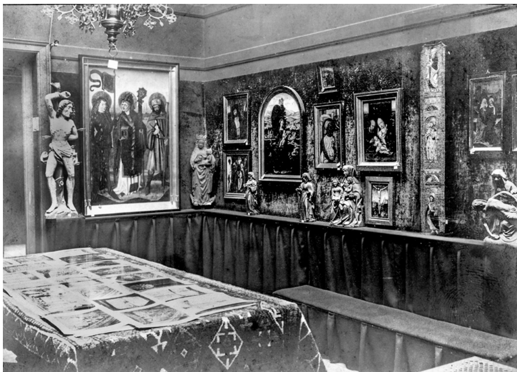
Afb. 7. Tentoonstelling Middeleeuwse Kunst, Utrecht, 1906, grote zaal rechts.