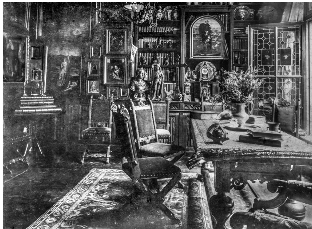
Afb. 9. Interieur woonkamer Wilhelm Mengelberg, Maliebaan 80, Utrecht, vóór 1920.