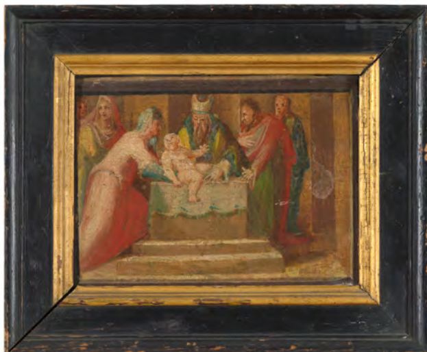
Navolger van Domenico Beccafumi (1468-1551), Siena Tweede helft zestiende eeuw De opdracht in de tempel Paneel 15,8 x 21,8 cm.