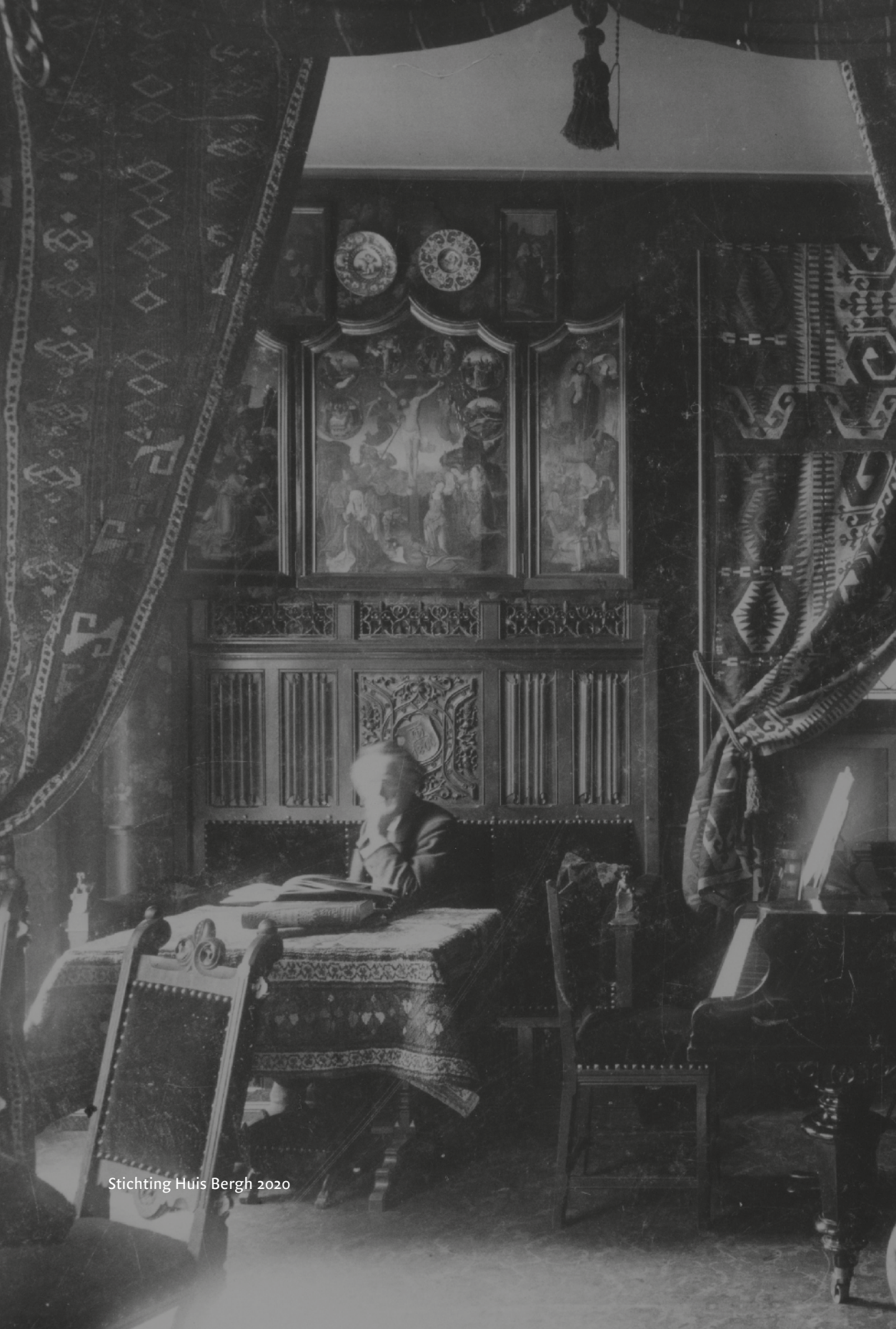
Stichting Huis Bergh 2020