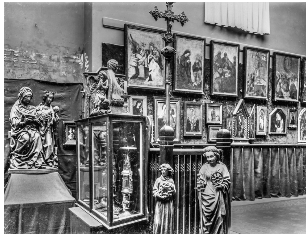
Afb. 5. Tentoonstelling Middeleeuwse Kunst, Utrecht, 1906, interieur van de voorzaal.