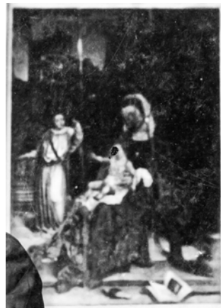
Fotobewerking Lex Raat