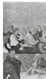
Afbeelding catalogus Amsterdam 1934, nr. 11 [Ma21]