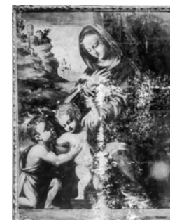
Familiearchief Zander ter Maat

► Foto uit archief van Mengelberg ca. 1875-1899