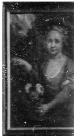
Fotobewerking Lex Raat

► Detail uit familiefoto, particulier bezit