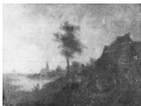
Fotobewerking Lex Raat