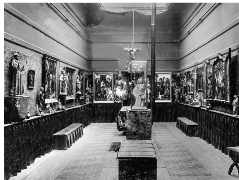
Afb. 6. Tentoonstelling Middeleeuwse Kunst, Utrecht, 1906, interieur van de grote zaal.